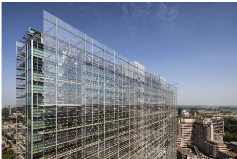
Foto 3: Europäisches Patentamt in Rijswijk/NL von Ateliers Jean Nouvel, Paris / Dam & Partners Architecten, Amsterdam

Wir würden uns freuen, wenn Sie im Rahmen Ihrer redaktionellen Berichterstattung auf den Internationalen Architektur-Kongress hinweisen würden. Die Fotos dürfen im Zusammenhang mit einem Bericht über die Veranstaltung und mit Angabe der Quelle genutzt werden. Im Falle der Berichterstattung bitten wir um einen Beleg.