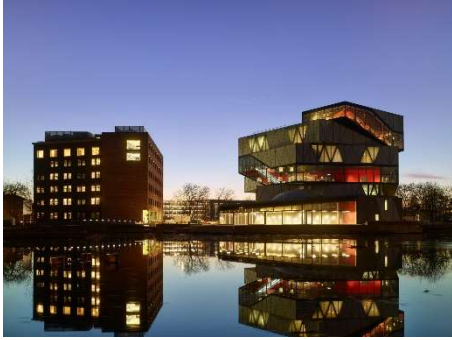
Foto 2: „experimenta“ in Heilbronn von Sauerbruch Hutton, Berlin